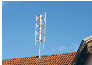
Abbildung von Sirenenystemen

Das beste Warnsystem nützt wenig, wenn die Warnungen nicht verstanden werden. Die nachfolgenden Informationen und Hinweise in diesem Faltblatt sollen Ihnen helfen, „im Falle des Falles“ die Sirenensignale richtig zu deuten und entsprechend zu handeln.